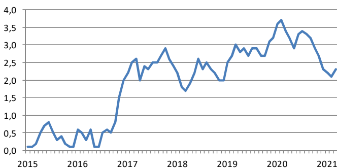
Vývoj inflace (CPI y/y, %)

Spotřebitelské ceny v březnu oproti únoru vzrostly o 0,2 % a v meziročním srovnání došlo ke zrychlení spotřebitelské inflace na 2,3 % z únorových 2,1 %. Zdražily pohonné hmoty, dále vzrostly i ceny tabákových výrobků, do kterých se začíná promítat zvýšení spotřební daně. Mírně vzrostly i ceny oděvů a obuvi, klesly jen ceny dovolených na závěr zimní sezóny. Na meziročním růstu inflace se ze dvou třetin podílejí dražší alkohol s tabákem a oddíl doprava. Mírně meziročně poklesly ceny potravin a nealkoholických nápojů.